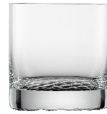
Whiskyglas UVP 9,95 €