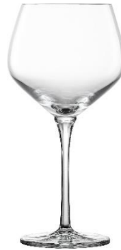
Burgunder Rotweinglas UVP 11,95 €