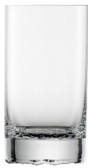
Allroundglas UVP 9,95 €