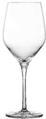
Rotweinglas UVP 11,95 €